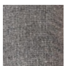
Linho Cinza Médio